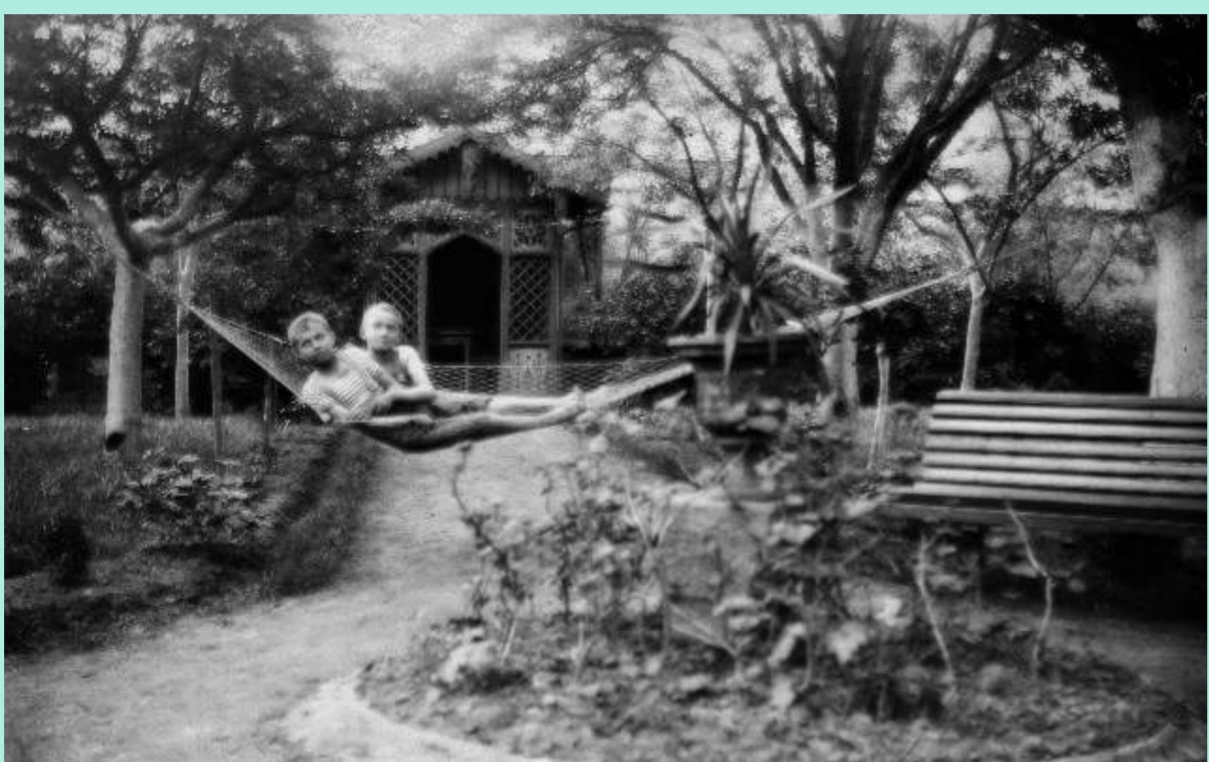
Na zahradě rodného domu ve Wurmově ulici č. 24 s bratrem Ondřejem v červnu 1913.

Přerovský patriot, učitel, ochranář a především výjimečný člověk.