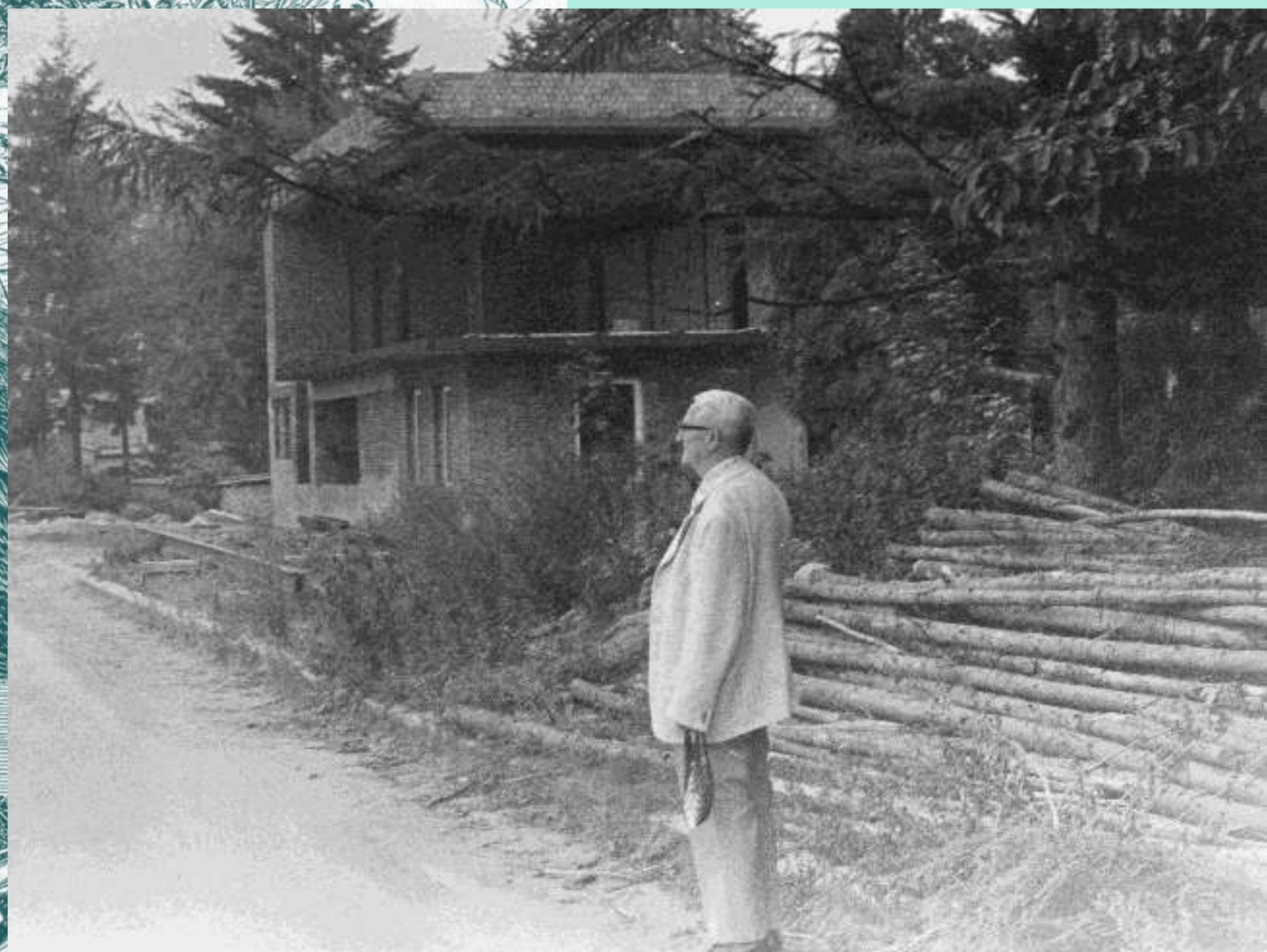
Iniciátor vzniku spolku, který myšlenku ochrany ptactva a stavbě ornitologické stanice věnoval celý svůj život. V pozadí stavba moderní budovy stanice v r. 1979.