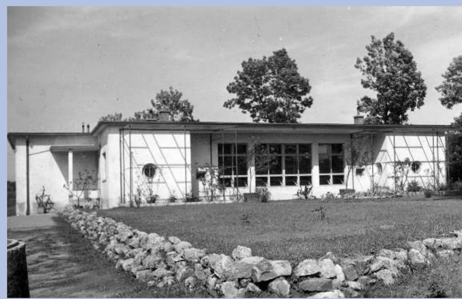
V r. 1938 byla stanice každou nedělí otevřena pro veřejnost.