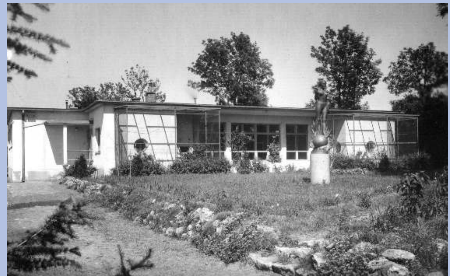
Socha „Světlušky“ která je dnes opět součástí areálu Ornitologické stanice Muzea Komenského (r. 1938).