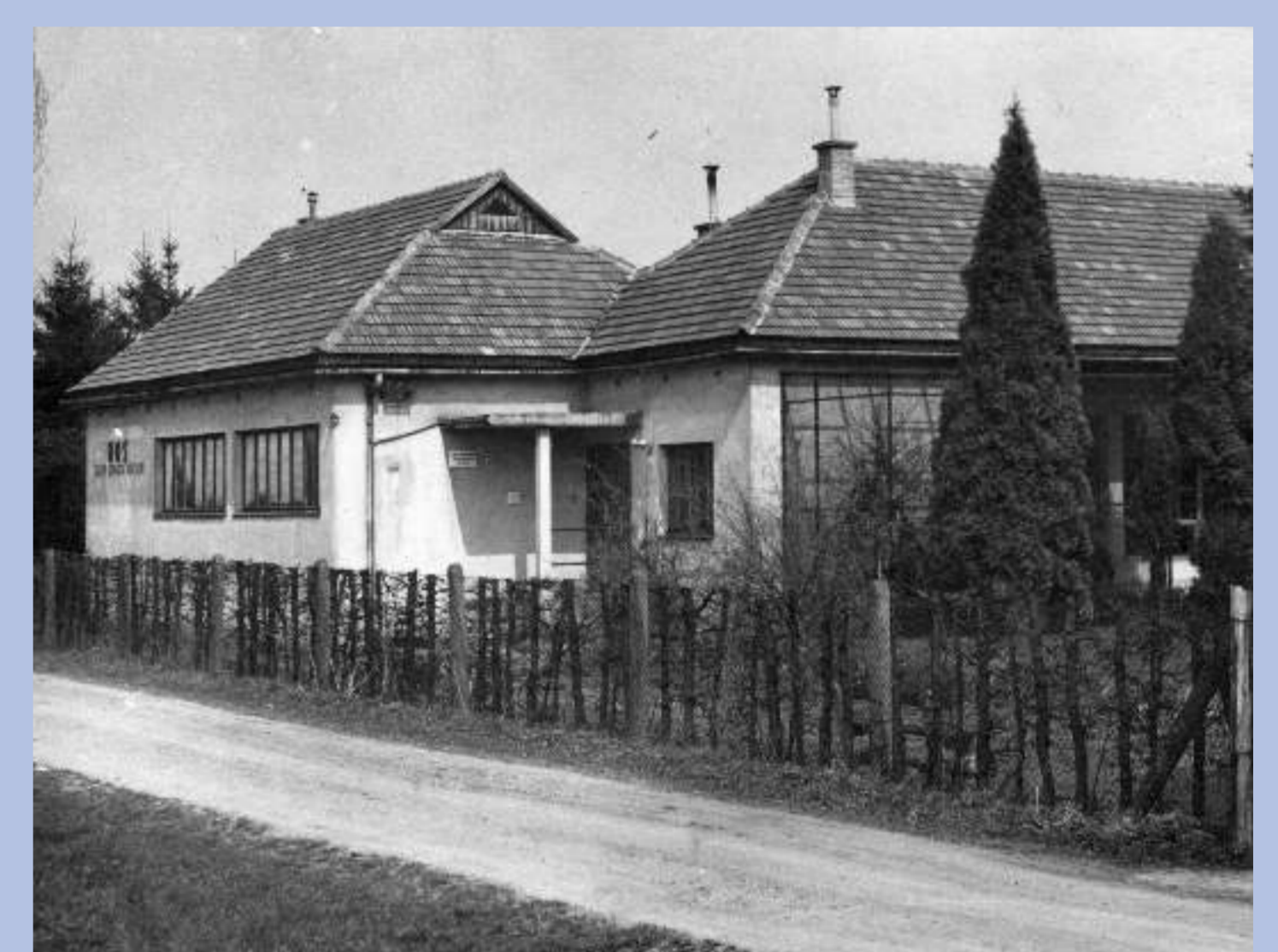
Nová podoba Moravské ornitologické stanice na jaře v roce 1956. Dluh na tuto novou střechu spláceli členové výboru po méně reformě v roce 1953 v hodnotě 1:5 až do roku 1959.