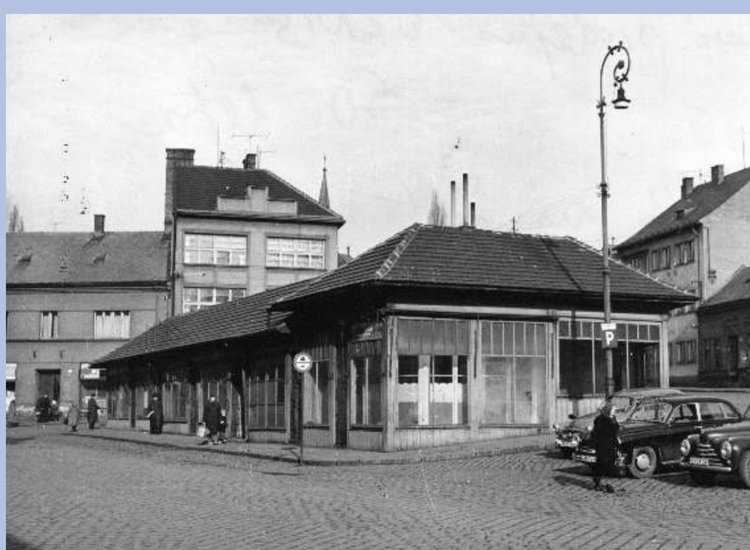
Pohled na „špalíček“ na Žerotínově náměstí, kde spolek pronajal družstvu ORNIS dva obchody.