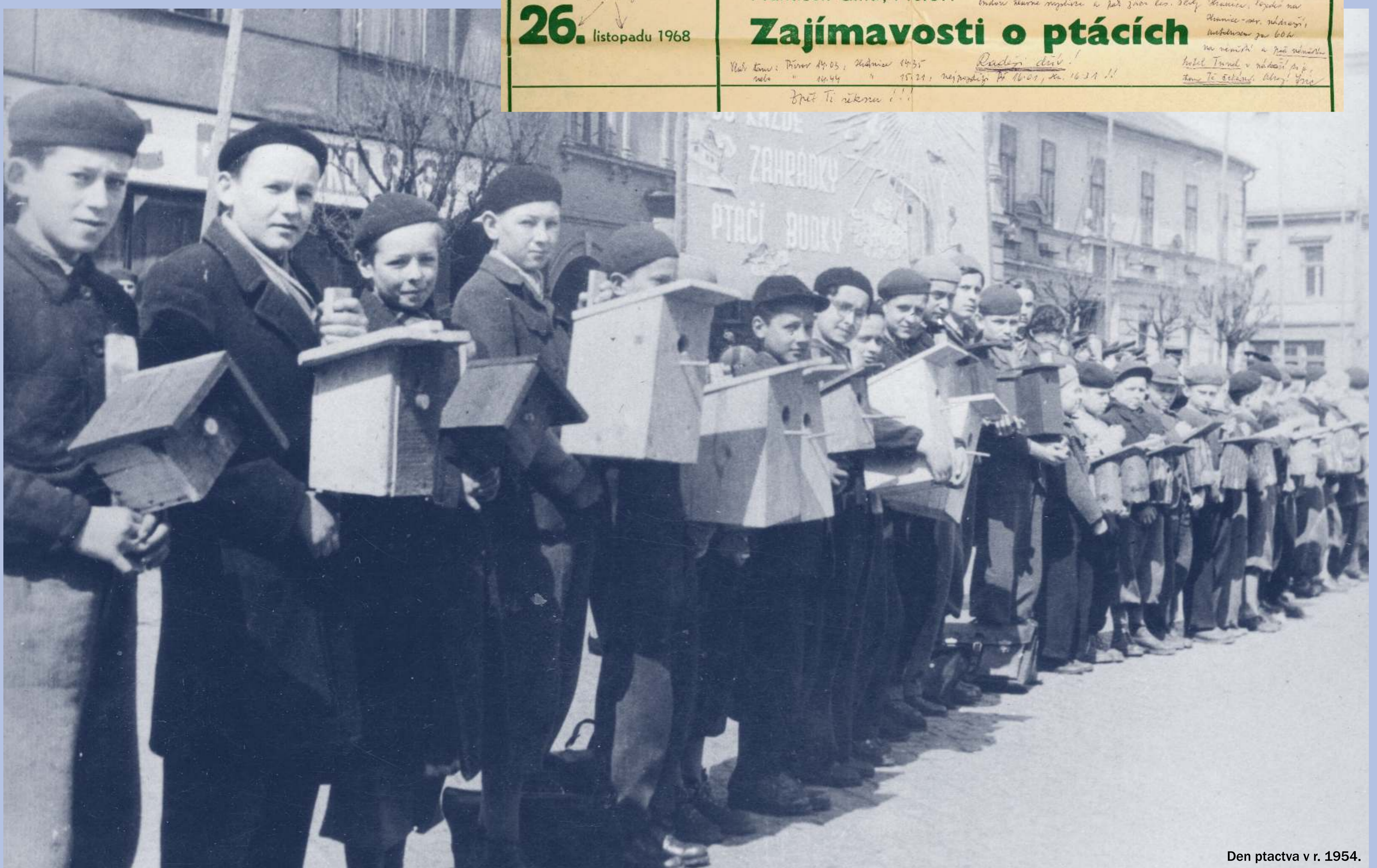
Den ptactva v r. 1954.