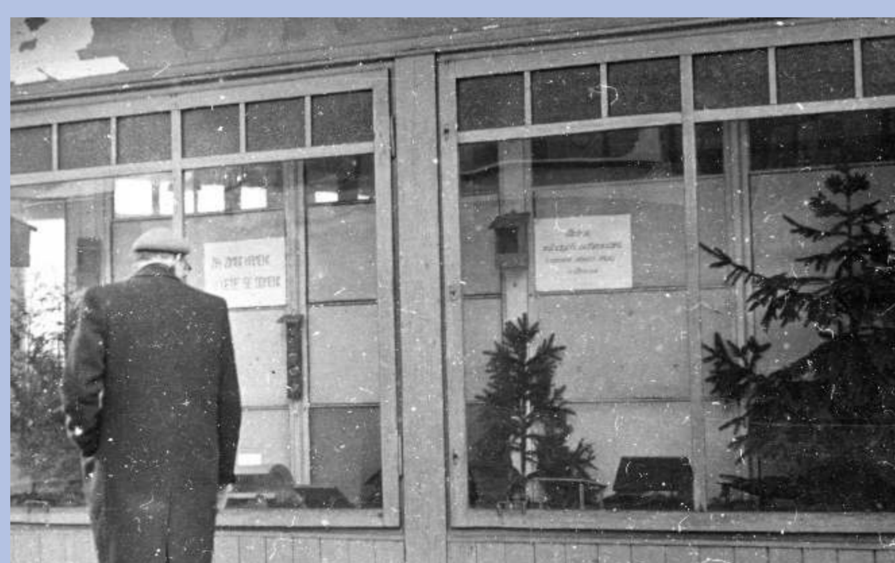
50. léta, provozovna družstva ORNIS na Žerotínově náměstí.