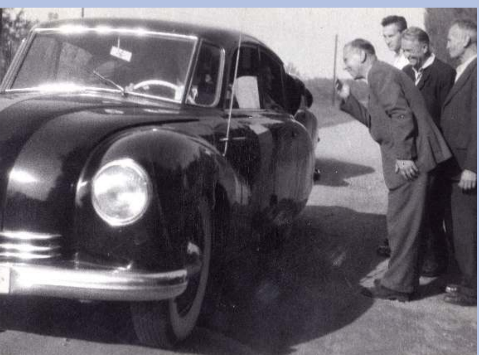
Loučení s dr. F. Kahudou.