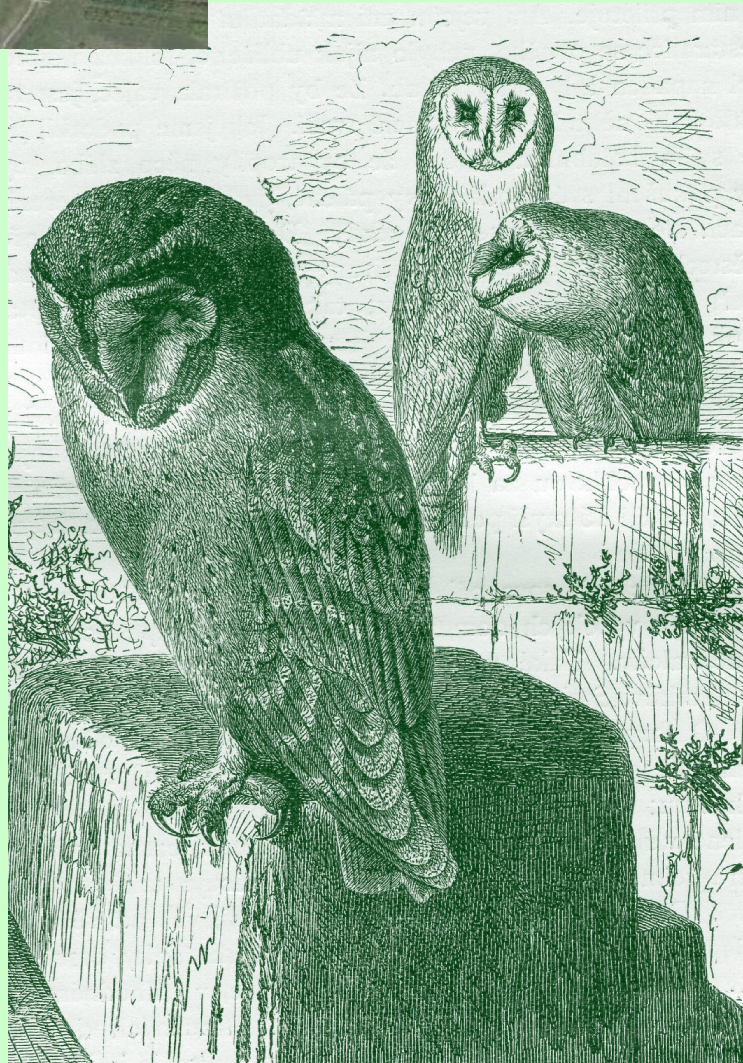
Leták MOS propagující Stanicí pro hendikepované živočichy u hradu Buchlov