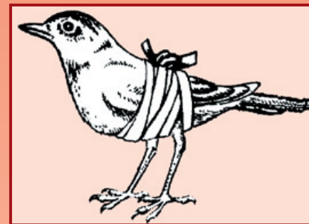
Fixace zlomeného křídla

Nález ptáka neprodleně oznámíme a nebo předáme do stanice pro záchranu hendikepovaných živočichů, kde by již měli zajistit vše potřebné. Pokud nám okolnosti neumožní nalezeného ptáka v nejbližší době předat do odborné péče, musíme se o něj na přechodnou dobu dále postarat sami, tzn. zajistit rovněž přiměřenou výživu. Snažíme se však, aby tato doba byla co možná nejkratší.