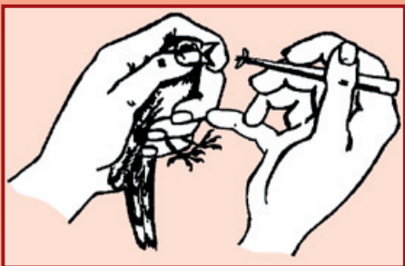
Uchopení dospělého ptáka při krmení

Řada ptáků v zajetí či následkem zranění potravu odmítá přijímat. Takovéto ptáky musíme potom krmit sami. Nehty opatrně otevřeme zobák, potravu vložíme za jazyk do jícnu. Potravu podáváme na dřívku nebo pinzetou, popřípadě lžičkou a po každém soustu vyčkáme až pták potravu spolkne a po chvíli v krmení pokračujeme. Hmyzožravé ptáky krmíme každé dvě hodiny, zrnojedům naplníme volátko třikrát za den a dravce krmíme dvakrát denně. Neopeřené ptáky, holátka, krmíme každou hodinu a aby nenastydla, přikrýváme je vlněným hadříkem nebo vatou a necháme v teple.