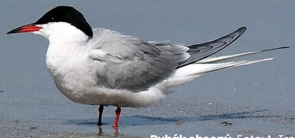
Rybák obecný.

Akci pořádáme ve spolupráci s místními kolegy z Jihočeského ornitologického klubu.