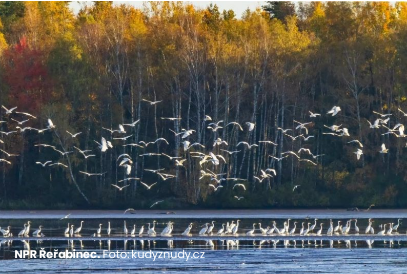
NPR Režabinec.